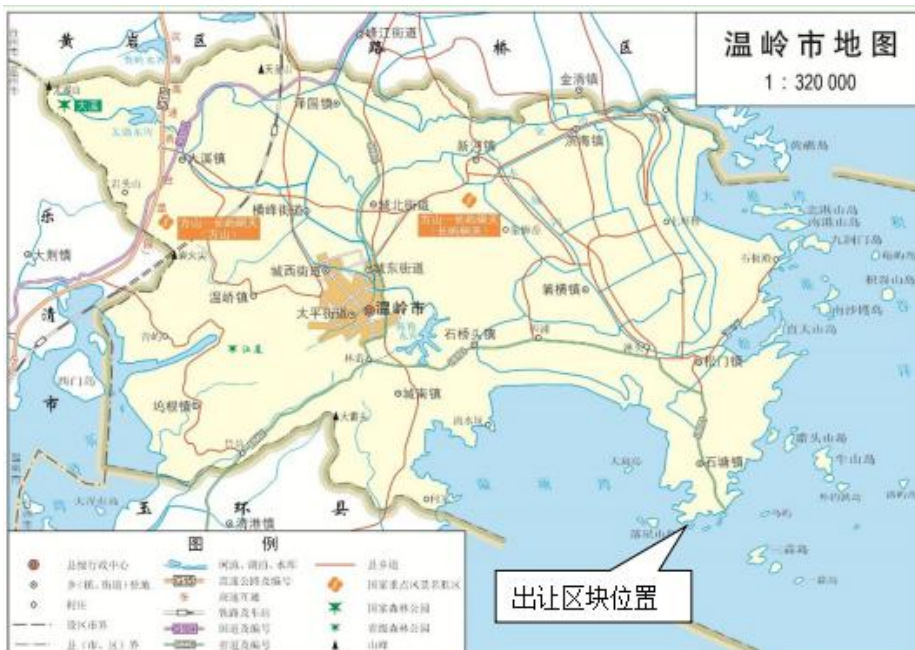
图 1 出让区块地理位置图

1、出让标的：温岭市2023-3区块海域使用权。出让区块位于温岭市石塘镇棺材屿西侧，宗海面积为0.4687公顷，地理中心位置坐标为东经121°35'21"，北纬28°14'47"。码头西北距温岭市城区约30km，与温岭中心渔港石塘港区相邻。见图1地理位置图、图2出让区块范围。