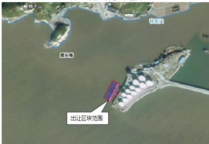
图 2 出让海域区块范围图