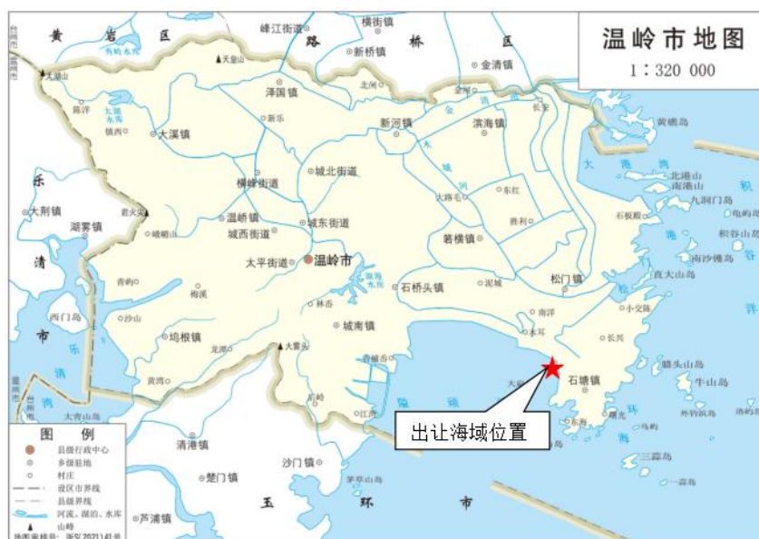
图1出让海域地理位置图

1、出让标的：温岭市苍山门海域的海域使用权，宗海面积为196.1779公顷，距离温岭市区约15km。养殖用海区域东临温岭市上马工业区，西侧为隘顽湾滩涂，北面为陆地海水池塘和农田，南面临海。见图1地理位置图、图2出让海域范围图。