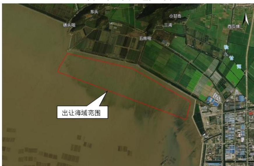
图2出让海域区域范围图